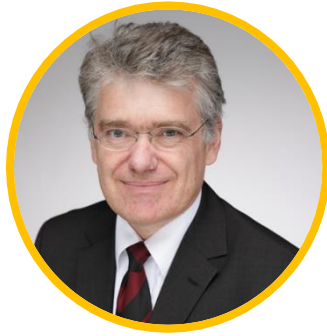
K i s s c