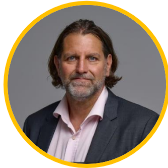
l b c J c a f c